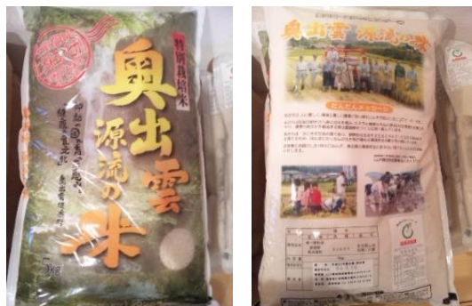
店頭で販売される奥出雲町源流米 5キロ 3,480円！！