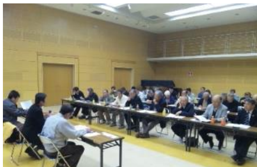
(株)大朝農産の代表者3名から、法人間連携を通じた事業展開の説明を受ける参加者

しかし、それぞれが目的別に組織を立ち上げ、それぞれ作業受託を行っていたため作業が過度に集中することで作業適期を逃しやすくなり、収量や品質の低下を招いているという認識が高まり、作業時期の調整による効率的な生産の実施を目的とする「大朝町集落法人ネットワーク」を平成15年に設立。同ネットワークでは、コメ袋の共通化による「大朝米」ブランドの確立、大豆色彩選別機、ショットガンシーダー（水稲打ち込み式散播直播機）、無人ヘリなどの諸機械を導入し、省力化と品質向上が図られた。さらなる効率化を進めるため、集落営農法人、個別農家という複数主体と、それらを束ね組織する3組織（大豆生産組合・集落法人ネットワーク・飼料稲生産組合）を一本化すべく、品目横断的経営安定対策が導入された年17年に株式会社大朝農産が成立するに至った。